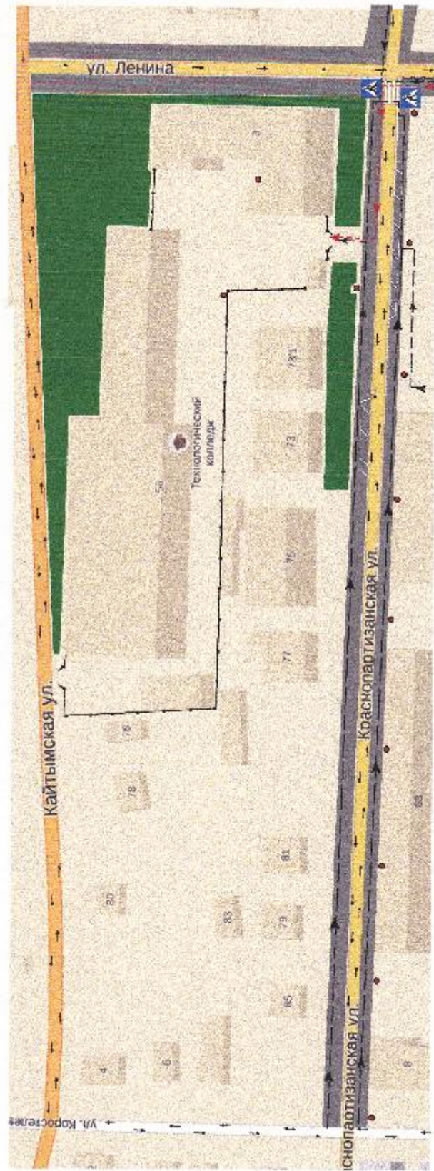
Схема организации дорожного движения в непосредственной близости от образовательного учреждения